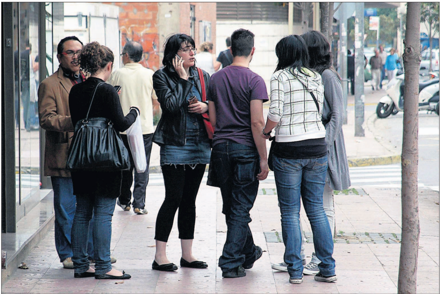
Spaanse jongeren onder de dertig komen nauwelijks meer aan een baan en dreigen een verloren generatie te vormen.

'Generatie nul' noemen Spaanse jongeren zich zelf: nul kans op werk, nul inkomen, nul uitzicht op zelfstandigheid.