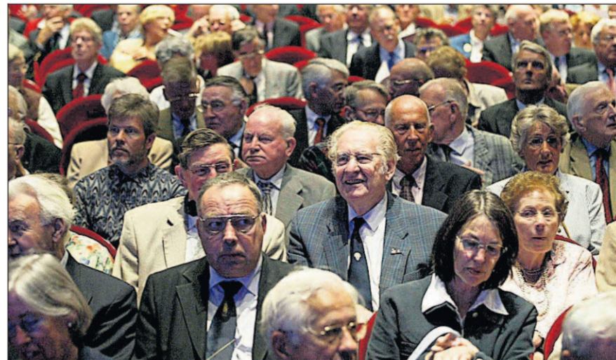
Voor aandeelhouders, ook 'trouwe', is in de eerste plaats van belang hoeveel ze met hun investering verdienen.

ING houdt aandeelhouders sinds jaar en dag in het gareel via certificering van aandelen.